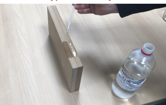
Рис. 1: нанесение ацетона на торцы образцов МДФ с грунтом-золятором и без